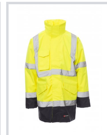
GIALLO FLUO/BLU NAVY