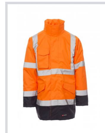
ARANCIONE FLUO/BLU NAVY