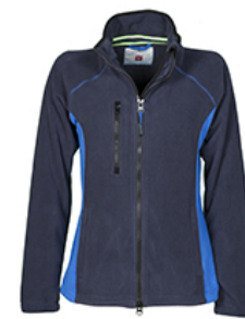
BLU NAVY/BLU ROYAL